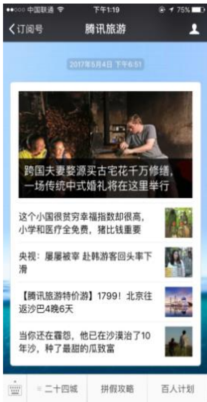
腾讯旅游微信公众号预热推广