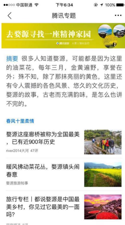
腾讯新闻专题推广